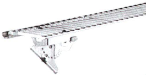
Bild 5: Laufsteg, Typ: MultiStep Endlos-Laufrost (95000), zur Montage bei Ton- und Betonpfannen