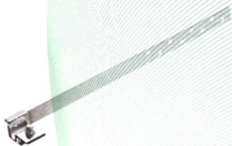
Bild 1: Verankerung, Typ: MultiStep Schienenhalterung (90000), zur Montage bei Ton- und Betonpfannen