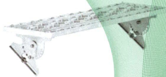
Bild 4: Trittfläche, Typ: MultiStep Langrost (98000), zur Montage bei Ton- und Betonpfannen